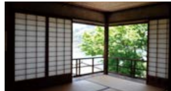
下蒲刈島の風情のある「白雪楼」で一服。