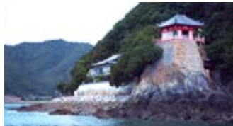
岩の上に建つ朱塗りの「阿伏兎観音」。

「尾道」や「鞆の浦」と同様に中世の港町として栄えた下蒲刈島「三之瀬」をご案内。星空観測場として知られる上蒲刈島（かみかまがりじま）沖に停泊するので、天候が良い際には、天体観測のご案内も予定しています。荒々しい岩の上に建つ「阿伏兎観音」を海から眺めたり、潮待ちの港「鞆の浦」で、江戸時代から残る町を散策したり。歴史情緒あふれる旅へと誘います。