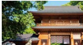
瀬戸内の美しい朝焼けに溶け込むガッツウ。 樹齢2600年の楠木を擁する「大山祇神社」。

箱庭のような景色を眺めながら「尾道水道」を通過し、「しまなみ海道」の橋が架かる島のひとつ、大三島沖へ向かいます。その日は大三島沖で錨を下ろし、静かな夜を迎えます。翌日は、清々しい空気に満ちた「大山祇神社」にご参拝。船内でお寛ぎになりたい方は、時間ごとに色を変える海と島の稜線を眺めながら、ゆったりとした朝をお迎えください。