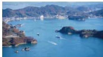
古い日本家屋と石畳が続く「鞆の浦」の路地。 古くからの海の難所「船折瀬戸」。