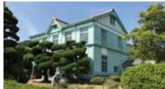
日本初の国立海員養成学校の旧校舎。