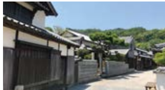
昔ながらの町並みが残る「本島」。

村上水軍とは対照的に、時の権力者とともに繁栄を続けてきた組織「塩飽(しわく)水軍」。そのゆかりの海域を巡り、繁栄を垣間見ることができる「本島」や「栗島」へご案内します。日本で最初の国立海員養成学校の旧校舎で、現栗島海洋記念館に出合えるのも「栗島」の特徴のひとつ。2日目は江戸時代の面影を色濃く残す、潮待ちの港「鞆の浦」沖で錨泊いたします。