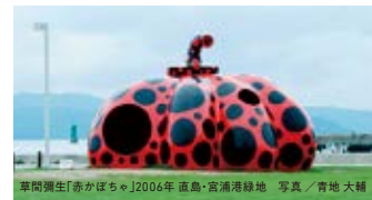
直島に点在する作品の一つ。