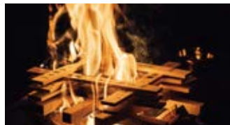
小豆島の「碁石山」で護摩炊きを体験。

「しまなみ海道」の島々を通過し、採石場として100年以上の歴史を誇る「北木島」の沖合へ。高さ70メートル以上ある石の深谷は迫力満点。島の生活や風景に溶け込む現代アートを「直島」や「犬島」などでお楽しみいただくほか、「小豆島」では、山の洞窟に祀られた「波切不動明王」さまへのご参詣も。雄大な自然美とアートで感性が磨かれる旅へのご案内いたします。