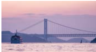
下津井の沖合いから眺める「瀬戸大橋」。