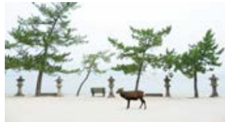
早朝の清らかな空気に満ちた宮島で散策を。

「尾道水道」を抜けて、世界遺産のある「宮島」へ。早朝の清々しい空気の中での「厳島神社」へのご参詣や、古い町並みが続く「町家通り」を散策します。午後は穏やかな島の暮らしに触れられる、広島県最西端の「鹿島」へ。2日目は朝鮮通信使が度々入航したと伝わる上関沖で停泊し、石積みの練堀が美しい山口県「祝島」などにもご案内。繊細な多島美と素朴な島の今とむかしをご覧ください。