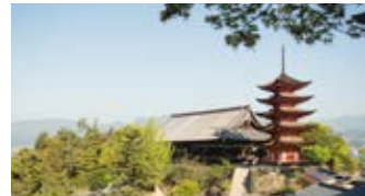
重要文化財に指定された宮島の「五重塔」。