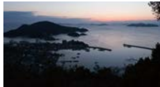
潮待ちの港として栄えた「鞆の浦」。

江戸時代からほぼ変わらぬ姿を残す港町、広島県「鞆の浦」。映画やドラマの舞台としても知られる風情ある町並みは、懐かしく温かな雰囲気。まだ町が起き上がらない清々しい空気の中、ノスタルジックな街あるきをお楽しみいただけます。ゆっくりと朝を迎えたい方は、鞆の沖合いを行き交うちいさな船の様子をご覧くださいながら、のんびりとお寛ぎください。