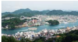
風光明媚な海峡「尾道水道」の景色。