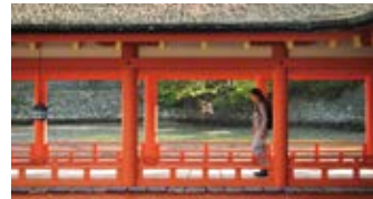
朝の清々しい「厳島神社」へご参拝。