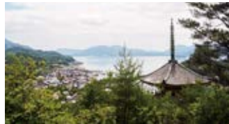
「神の島」と言われる大三島で錨泊。

瀬戸内が誇る歴史的遺産のある島々を巡ります。初日は世界遺産「厳島神社」を擁する宮島沖で錨泊。翌朝は清らかな空気に包まれた島を散策し、「厳島神社」をご参拝。広島県の最南端「鹿島」で海産物加工場を見学した後、「国宝の島」「神の島」と呼ばれる愛媛県「大三島」の沖合で錨泊いたします。島で受け継がれてきた歴史や信仰を垣間見ることのできる航路です。