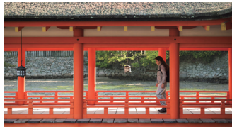
朝の清々しい「厳島神社」へご参拝。

両側の陸が接近して海が狭くなっている所を指す言葉「狭門(せと)」。それゆえ瀬戸内海と呼ばれるようになったこの海域には、海上交通の安全を願い、島の要所に神が祀られてきました。世界遺産・宮島の「厳島神社」や大三島の「大山祇神社」もそのうちの一つ。2つの神の島で古来から続く海上安全信仰や歴史に触れつつ、「せと」を実感する挟水道と多島美をお楽しみください。