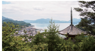
「神の島」と言われる大三島で錨泊。